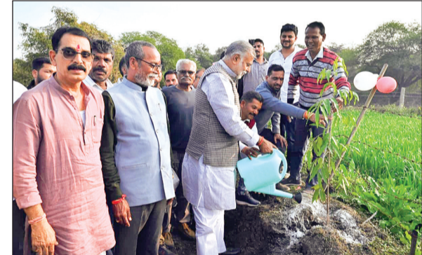
विदिशा। अभियान के तहत रंगई गांव में पौधरोपण करते हुए मंत्री प्रहलाद पटेल।

पंचायत एवं ग्रामीण विकास तथा श्रम मंत्री प्रहलाद सिंह पटेल शनिवार को रंगई गांव में आयोजित पौधरोपण कार्यक्रम में शामिल हुए। यहां जनसहभागिता से विभिन्न प्रजाति के 251 पौधे लगाए गए। कार्यक्रम में मंत्री पटेल ने कहा कि सार्वजनिक भूमि का उपयोग सार्वजनिक हितों को पूर्णतः ध्यान में रखकर करना चाहिए। कई स्थानों पर भूमि के अभाव में शासकीय भवनों के निर्माण कार्य प्रभावित होते हैं, इसलिए उपलब्ध भूमि का सुव्यवस्थित और दूरदर्शी उपयोग आवश्यक है। उन्होंने गौशालाओं के आसपास बड़े वृक्ष लगाने पर विशेष जोर देते हुए कहा कि इससे गौवंश के संवर्धन, स्वास्थ्य संरक्षण और अनुकूल वातावरण निर्माण में मदद मिलेगी।