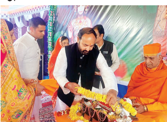
आनंदपुर