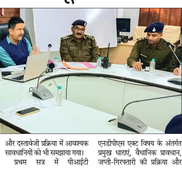
एनडीपीएस एक्ट विषय के अंतर्गत प्रमुख धाराएं, वैधानिक प्रावधान, ज्वती-गिरफ्तारी की प्रक्रिया और

वाली कानूनी प्रक्रियाओं पर विस्तार से मार्गदर्शन दिया गया। ज्वती के दौरान पंचनामा, सैपलिंग, सीलिंग और दस्तावेजी प्रक्रिया में आवश्यक सावधानियों को भी समझाया गया। प्रथम सत्र में पीआईटी