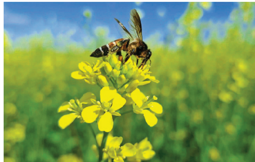
गंजबासोदा। पीले सरसों के फूलों पर एक व्यस्त मधुमक्खी खेत में खड़ी सरसों की फसल में आए फूलों से शहद के लिए रस इकट्ठा करती मधुमक्खी।